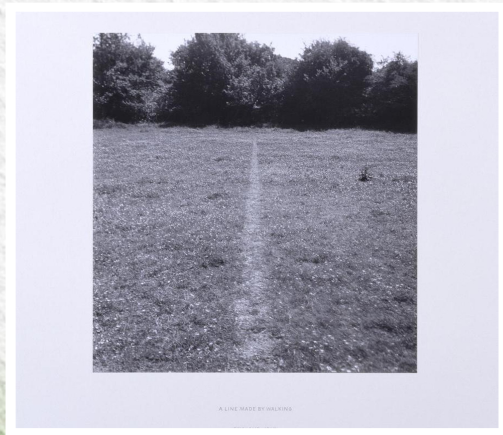
Richard Long, "A Line Made By Walking" (1967)