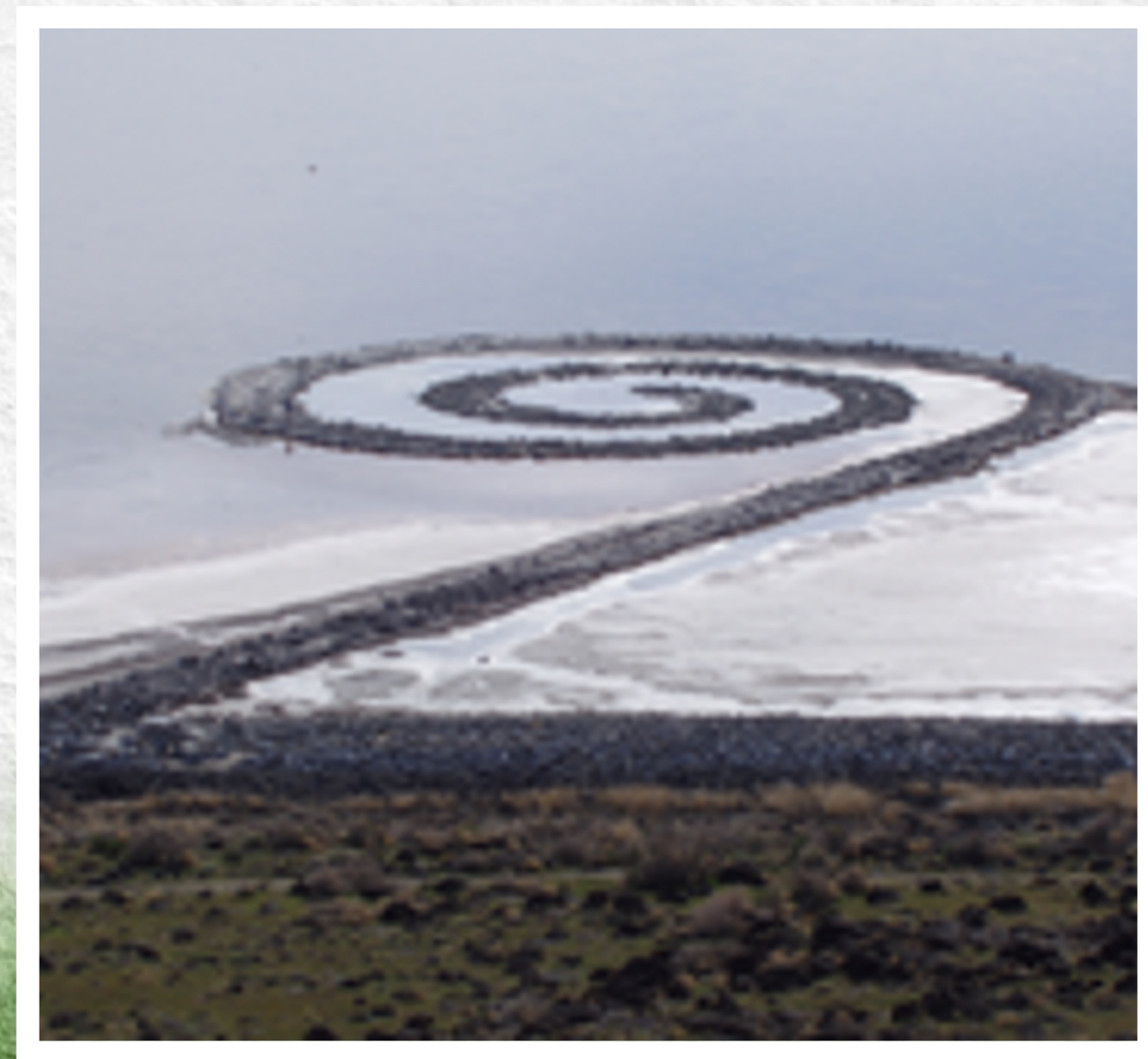
Robert Smithson, "Spiral Jetty" (1970)